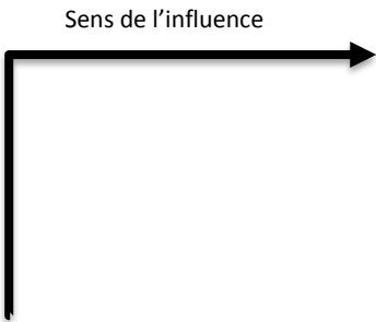
Tableau 4 : impact du profil d'évolution sur les activités.